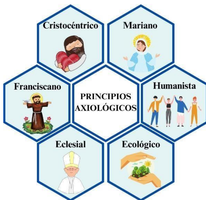
Figura 1 Principios Axiológicos

El término de axiología deriva del griego axios: donde se refiere a lo preciado y valorable que nos muestra que es la equivalencia en Cristo a modo de alfa y omega, y único ser de Cristo, y somos de Cristo para Cristo, donde la vida cristiana todo tiene sentido. Por ello permanecer en Cristo, en obediencia y contemplación de los misterios. De aquel estudio se profundiza la escritura, litúrgica, exclusivamente en la eucaristía de aquel templo.