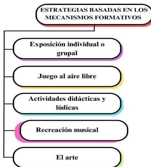
Figura 5 Estrategias Basadas en los mecanismos formativos

Por otro lado, las rúbricas de observación de la docente en aula valoran la conducción del proceso de enseñanza y aprendizaje en el niño teniendo en cuenta los diferentes espacios del centro educativo donde la docente y estudiantes puedan interactuar dentro de clases en aula con el dominio de los temas y el manejo del estudiante. Es relevante destacar que la participación activa de los padres en la educación infantil ya que es significativo en el aprendizaje y proceso integral de los niños y niñas . La colaboración entre padres y educadores crea un entorno de apoyo y enriquecimiento para los estudiantes, lo que puede obtener un impacto importante en su crecimiento académico, emocional y social. En este aspecto influye también la tecnología, ya que puede tener un impacto significativo en el aprendizaje y desarrollo de los niños , siempre que se implemente de manera equilibrada y consciente. La tecnología puede ser una herramienta poderosa para enriquecer la experiencia educativa y promover el desarrollo de habilidades importantes , pero es fundamental reconocer que no puede reemplazar por completo el mecanismo formativo tradicional.