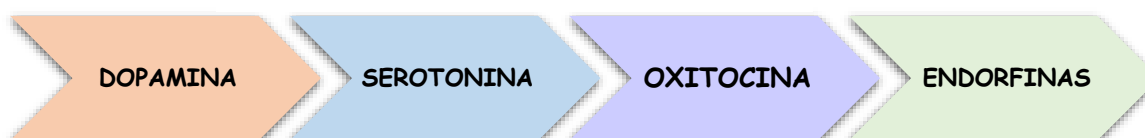
Figura 2 Los 4 neurotransmisores

Dentro de lo que conlleva las estrategias didácticas, así como recurso y herramienta de adquisición de aprendizajes significativos también favorece al proceso afectivo, cognitivo, sensorial y psicomotrices ya que permitirá que los estudiantes activen sus neurotransmisores del cerebro las cuales son las son los neurotransmisores.